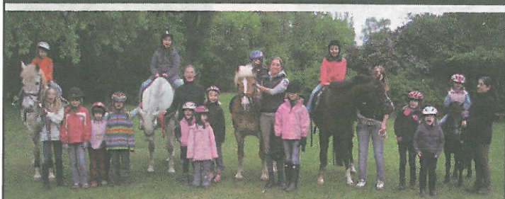
Reitverein Hannover e.V.

Vielseitigkeitsreiter und natürlich auch ihre Pferde werden von vielen als die Superlative des Reitsports gesehen – weil sie sich allen Disziplinen stellen: