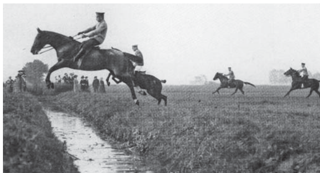
Offiziere der Kavallerieschule in der für die damalige Zeit ( 1912) noch typischen Springmanier im Isernhagener Jagdgelände.

eine Etagenwohnung in der Hohenzollernstrasse 30. Der Dienst an der Kavallerie-Unteroffizierschule begann stets um 5 Uhr morgens. Den Weg von der Hohenzollernstrasse dorthin legte er mit dem Fahrrad zurück.