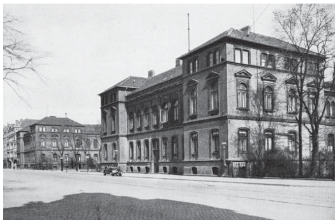
Das Stabsgebäude und Offiziersheim der Kavallerieschule Hannover an der Vahrenwalder Strasse in den dreißiger Jahren des vergangenen Jhdts.