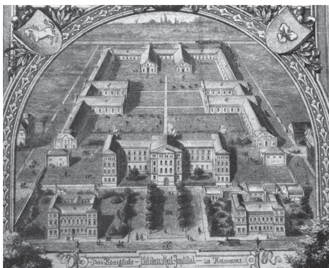
Blick aus der Vogelperspektive auf das Königliche Reit-Institut zu Hannover an der Vahrenwalder Strasse im Jahr 1876, diese Zeichnung erschienen in der Leipziger Illustrierten Zeitung vom 24. August 1878.