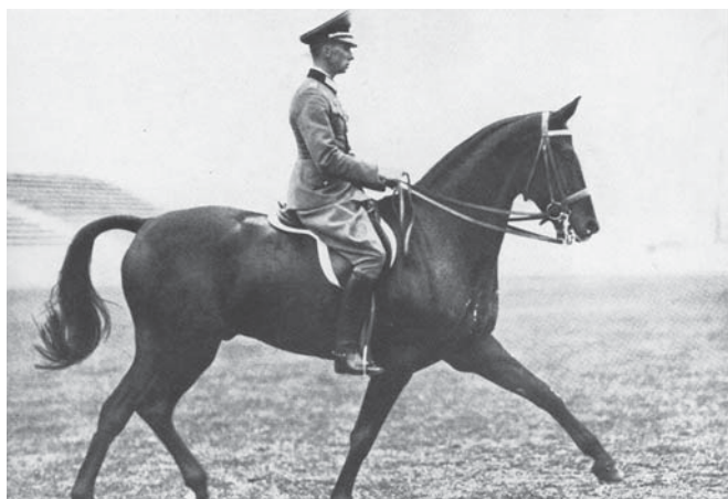
Goldmedaillengewinner in der Großen Dressurprüfung der Olympiade 1936, H. Pollay, mit dem Ostpreußen Kronos.

te die deutsche Mannschaft, bestehend aus H. G. Winkler, H. Steenken, A. Schockemöhle und H. Schridde, in Mexiko die Bronzemedaille erringen. Seit mehr als drei Jahrzehnten finden an diesem historischen Ort, wo schon zu früheren Zeiten die Reiter des M.R.I. und der K S ihre Jagden und Rennen ritten, immer wieder die traditionellen Landesturniere statt, auf denen im harten Wettbewerb die Landesmeister eines jeden Jahres ermittelt werden.